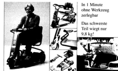
*Super light*, bis 6 km/h - Vorwärts- u. Rückwärtsgang, fahrerscheinfrei, Weileder GmbH, Zentrale Garching

paraplegiker Das Fachmagazin für Behinderte 29. Jahrgang - Heft 3/2009