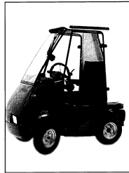
Foto: „Carella“, 10 km/h und 16 km/h – Weileder GmbH, Zentrale, Garching